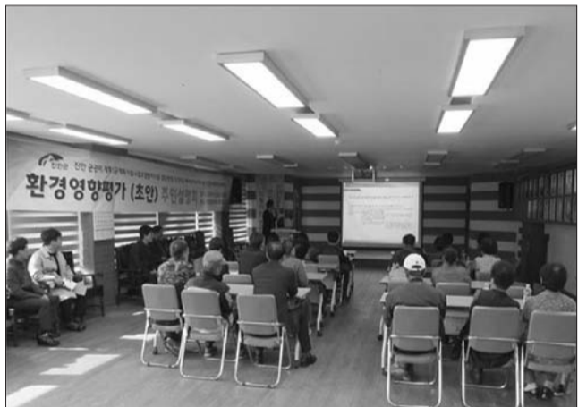
진안군이 폐자원 에너지화시설 민간투자사업의 환경영향평가서 초안을 주민들에게 공개하고 다양한 의견을 수렴하기 위해 지난 5일 진안읍사무소 회의실에서 주민설명회를 가졌다.