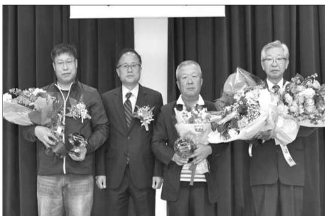
장수군 산서면은 최근 산서초등학교에서 제41회 산서면민의 날 행사를 성황리에 마쳤다.

무주군은 무주국제화교육센터가 지역 학생을 비롯한 주민들의 외국어 교육은 물론 국제적 시각과 사고의 폭을 넓히는데 필요한 요람이 될 수 있도록 한다는 방침으로, 무주국제화교육센터와 함께 다양한 프로그램 개발 및 운영에 내실을 기해 나갈 계획이다.