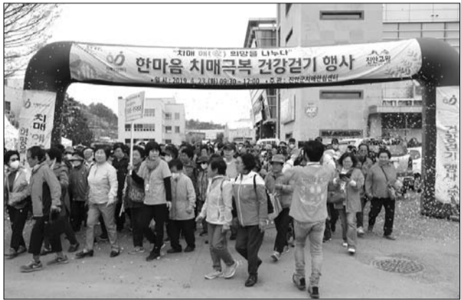
진안군은 23일 치매환자 및 가족, 지역주민 등 300여명이 참석한 가운데 한마을 치매극복 건강걷기 행사를 진안고추시장에서 성황리에 개최했다.