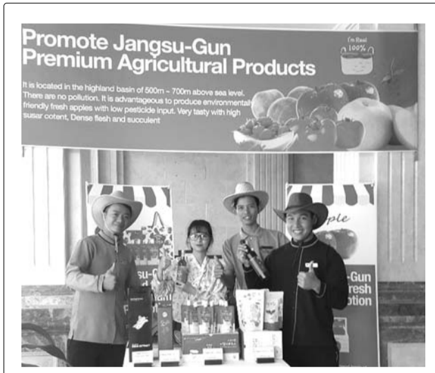
(사)장수식품클러스터사업단은 지난 24일부터 29일까지 베트남 THE SAILING BAY BEACH RESORT에서 ‘베트남 장수 농식품 홍보관축전’을 펼쳤다.