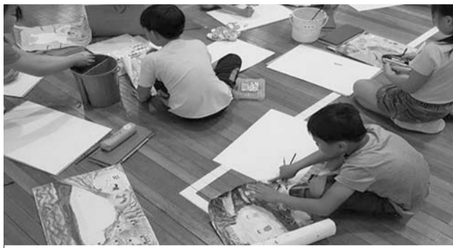
진안군과 진안군자연보호협회의에서 지난 15일 '제31회 자연보호 및 기후변화 그림그리기대회'를 진안초등학교 대강당에서 개최했다.

예정이다. 27개국에서 초청한 총 77편의 영화가 선보일 예정인 가운데 한국영화장편영화 경쟁부문인 '창' 섹션에서는 동시대 최신 한국독립영화를, '판' 섹션에서는 국내외 최신영화와 고전영화를, '락'과 '숲' 섹션에서는 영화와 라이브 연주, 심야영화를 즐길 수 있다. 마을로 가는 영화관 '길' 섹션에서는 향로산 자연휴양림 "별밤소풍(별자리 찾기 + 영화상영)"을 즐길 수 있다. 이외에도 이병률, 정인, 에디킵, 데이브레이크 등의 뮤지션들이 참여하는 유월의 숲(영화+음악+대화)을 비롯해 가족 프로그램과 산골미술관, 산골책방, 산골공방 등의 다채로운 행사가 펼쳐질 예정이다. 6월 21일 저녁 7시 등나무운동장에서는 그림마켓을 시작으로 개막식이 진행되며 가수 하림과 조정치, 박재정 등이 개막공연을 펼치며 제6회 무주산골영화제의 흥을 돋울 예정이다. /무주=전문선 기자