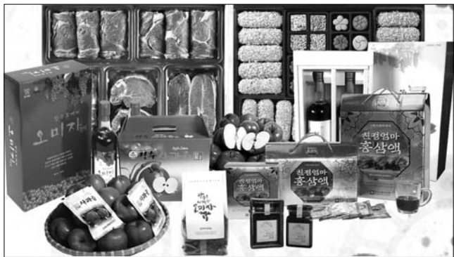
장수군이 우수 농특산물 판매 활성화 및 브랜드 경쟁력 강화를 위한 포장박스 표준 디자인 개발사업을 시작함에 있어 각 읍면사무소에서 2018년 3월 9일까지 현황조사를 실시한다.

장수군이 우수 농특산물 판매 활성화 및 브랜드 경쟁력 강화를 위한 포장박스 표준 디자인 개발사업을 시작함에 있어 각 읍면사무소에서 2018년 3월 9일까지 현황조사를 실시한다. 조사 대상은 장수군 농·특산물 생산 농가, 단체 및 장수물 입점업체로 조사 내용은 우리 군에서 생산되는 농특산물 포장재 사용 현황과 의견 제안서이며, 과일류, 과채류 등 10개 류의 디자인 표준안 샘플을 제작한다. 올해 시행하는 농특산물 포장박스 표준디자인 개발사업은 포장재 제작의 투명성, 형평성, 제작비용의 원가 절감, 포장재 디자인의 통일성 등 농가의 의견을 적극 수렴하고 간담회 개최 등을 통해 추진방안을 마련할 예정이다. 또한 타 지역의 제품과 차별화 될 수 있는 고품격 디자인 표준안을 농