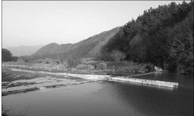
진안군은 8일 관내 하천에서 어도(漁道)를 설치해 생태계 복원 및 토산어종 보호에 적극 나서고 있다고 밝혔다. 사진은 운산리 상보 어도.

군은 이를 통해 내오천에 서식하는 붕어, 가물치, 미꾸라지, 파래미 등 내수면 어류가 강 상·하류로 자유롭게 이동할 수 있어 어류서식 환경에 큰 도움을 줄 것으로 기대하고 있다. 또한 그동안 집중호우 및 태풍 등 자연재난으로 훼손된 경계성 어종(겨지, 눈동자게) 등의 서식지와 산란에 적합한 환경복원, 생태계 환경 개선에도 기여할 것으로 전망하고 있다.