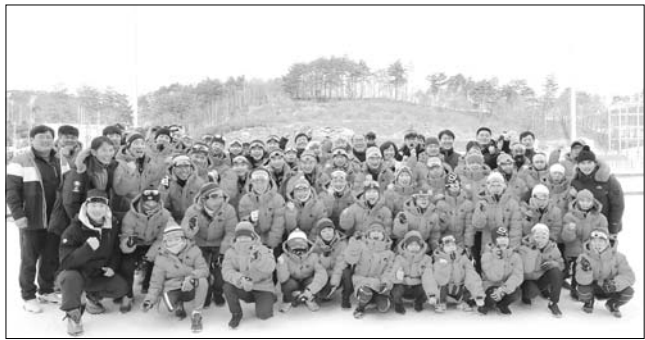
황정수 무주군수와 관련 공무원들이 지난 7일 강원도 평창 알펜시아 바이애슬론 경기장을 찾아 선수들을 격려했다.

무주군청 바이애슬론팀 선수들이 제99회 전국동계체육대회 바이애슬론 일반부 경기에서 선전(은메달 1개, 동메달 2개 획득)한 가운데 황정수 무주군수와 관련 공무원들이 지난 7일 강원도 평창 알펜시아 바이애슬론 경기장을 찾아 선수들을 격려했다.