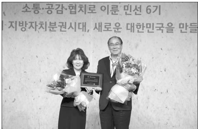
무주군이 13일 서울 밀레니엄힐튼호텔 그랜드볼룸에서 열린 2017 한국의 지방자치 경영대상 시상식에서 문화관광산업 활성화부문 대상을 수상했다.

특히 △2016 올해의 관광도시 조성 사업 추진을 기반으로 △2017 무주 WTF세계태권도선수권대회를 성공적 개최한 점, △환경과 관광을 접목한