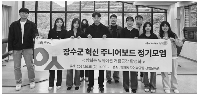
장수군 혁신 주니어보드가 15일 방화동 자연휴양림 내에 있는 위케이션 거점을 찾아 감성형 업무공간 등을 체험하고 생활인구 유입을 위한 거점 활성화 방안 모색에 나섰다.