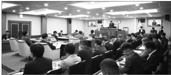
장수군의의회가 16일 제367회 임시회를 개최하고 오는 24일까지 9일간의 일정으로 회기에 돌입했다.

장수군의의회(의장 최한주)가 16일 제367회 임시회를 개최하고 오는 24일까지 9일간의 일정으로 회기에 돌입했다.