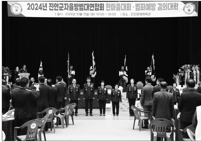
2024년 진안군자율방범연합회 한마음대회·범죄예방 결의대회. 15일, 2024년 10월 15일 (화) 10:00 - 16:00 | 장소, 진안문예체육관