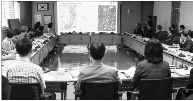
진안군은 23일 최근 군민들의 우려의 목소리가 높아지고 있는 345KV 신정읍-신계동 송전선로를 비롯한 3개 송전선로 문제에 대한 대책회의를 개최했다.

장 큰 문제는 주민들의 생활과 밀접한 연관이 있음에도 주민들에게 제대로 알리지 않고 진행되고 있다는 점에 인식을 같이하고, 향후 진행될 것으로 예상되는 신입설-신계동, 신장수-무주영동 송전선로 건설사업은 모든 진행 상황을 선제적으로 군민들에게 알리