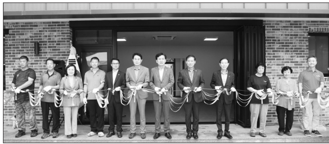
진안군은 지난 20일 회룡1마을 공동작업장에서 '회룡1마을단위종합개발사업' 준공기념을 위한 마을 행사를 가졌다.