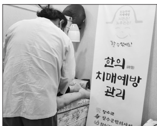
으며 매년 높은 사업 효과로 참여자들의 긍정적인 평가를 받고 있다. /장수=고관호 기자