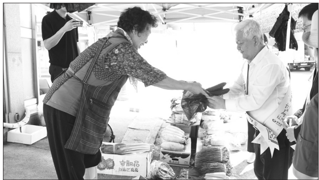
추석을 앞두고 무주군에서는 전통시장 장보기 행사가 한창이다.