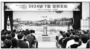
장수군은 3일 청원조회에서 혁신적인 업무 수행으로 탁월한 성과를 창출한 6개 부서에 2024년 상반기 장수군 혁신군정상을 시상했다.

청원조회에서는 상반기 정부모범공무원 시상을 비롯해 1·2분기 혁신군정상 시상과 상반기 민원후견인제 우수공무원 시상, 2분기 민원단축처리 우수공무원 시상도 함께 이뤄졌다. 상반기 정부모범공무원에는 보건사