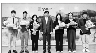
장수군은 3일 청원조회에서 혁신적인 업무 수행으로 탁월한 성과를 창출한 6개 부서에 2024년 상반기 장수군 혁신군정상을 시상했다.

최우수상에는 기획조정실 정책팀(1분기), 환경위생과 폐기물관리팀(2분기), 우수상에는 농업정책과 친환경농업팀(1분기), 장계면(1분기), 농업정책