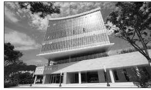
사진 왼쪽부터 무주상상반디숲 외부, 내부 모습