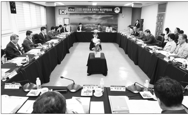
진안군은 3일 군청 상황실에서 안호영 국회의원과 함께하는 예산정책협의회를 갖고 주요 국·도비 사업에 대한 예산 확보와 당면 현안과제 해결을 위한 협력방안을 논의했다.

특히 수몰의 아픔과 수질보전의 의무를 감당하고 지역소멸의 위기를 가려온 용담댐을 우리군의 새로운 성장동력으로 이끌기 위한 △친환경 감성관광벨트 용담호 에코토피아 조성사업, △금강수계 수변구역 변경 등에 대해서도 정책적 배려와 지원의 필요성을 중점 건의했다.