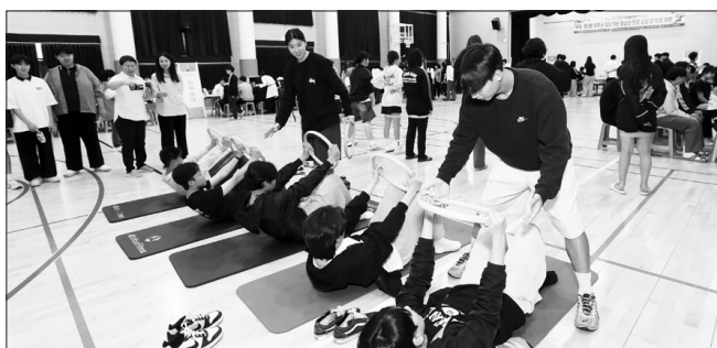
무주군은 28일 안성고등학교 강당에서 제9회 찾아가는 청소년 진로상담 및 직업 체험행사를 개최했다.

전주기전대학에서는 △응급구조사와 △치위생사, △토탈뷰티코디네이터(헤어, 네일, 메이크업), △피부관리사, △반려견 훈련사와 반려견 미용사, 동물복지사, △운동처방사, 트레이너, 체육지도사, △영상편집자, 크리에이터, 콘