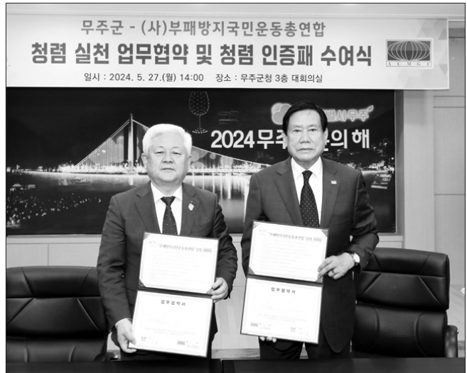
무주군이 27일 무주군청 대회의실에서 (사)부패방지국민운동총연합회와 청렴 실천 업무협약을 체결했다.