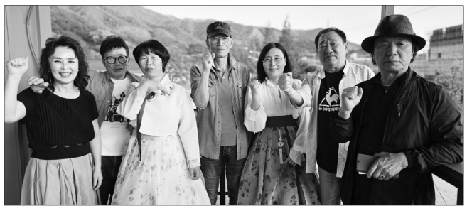
'장천유랑극단'이 10월 30일까지 매월 문화가 있는 날 주간 6개 마을을 찾아 복합문화 프로그램을 선보인다.

장수군은 오는 29일부터 10월 30일까지 '장천유랑극단'이 매월 문화가 있는 날 주간 6개 마을을 찾아 복합문화 프로그램을 선보인다고 밝혔다.