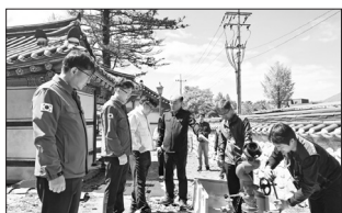
안전관리에 차질이 없도록 진행한다는 방침이다.

점검 시 소방서·한국전기안전공사 등 기관도 함께 시설물을 살펴 다각적인 위험 요인을 판단하고, 개선이 필요한 사항에 대해 현장에서 즉시 시정 조치를 하는 등 신속한 대책 마련으로