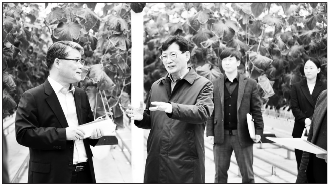
최훈식 장수군수는 임상규 전북특별자치도 행정부지사와 함께 지난 11일 계북면소재 청년 스마트팜과 장수읍 트레일빌리지 사업지를 방문하고 청년들과의 간담회를 진행했다.