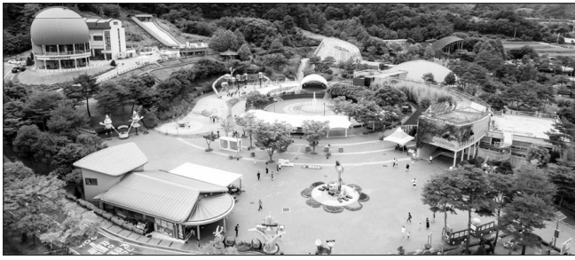
무주 반디랜드 전경

무주에서는 태권도원(모노레일 포함)과 반디랜드(곤충박물관, 천문과학관), 목재체험장, 머우와인동굴 등 총 5곳 입장이 가능하며 특별한 가맹점에서도 추가 할인(10%~30%)을 받을 수 있다. 무주군의 특별한 가맹점은 숙박이 가능한 무송송지역농조합법인(10%)과 그안렌션(명일 10%), 솔다박