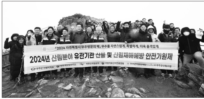
무주군 산림 분야 유관기관 관계자들이 20일 덕유산 향적봉에서 2024년 무주군의 산림 안전을 기원했다.