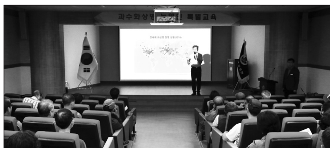
무주군은 과수화상병 예방을 위해 화상병 월동잠복처인 껍질 제거와 예방 교육 및 점검을 진행했다.