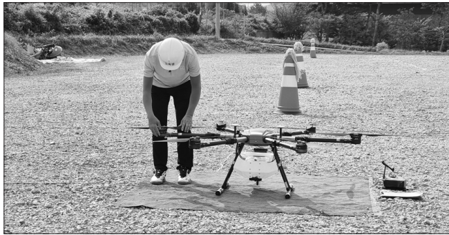
무주군이 드론 활용 기술을 농업에 접목해 농업인구 감소에 적극 대응하며 생산비 절감에도 기여하고 있다.

무주군이 드론 활용 기술을 농업에 접목해 농업인구 감소에 적극 대응하며 생산비 절감에도 기여하고 있다. 무주군에 따르면 지난 2019년부터 도비를 확보해 농업용 드론 전문가를 육성하고 있으며 66명을 대상으로 교육을 진행, 이중 55명이 자격증을 취득해 현재 병해충 방제 등 농업 현장에서 활용하고 있다.