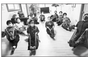
체조, 근력강화운동 등으로 진행한다. /진안=우태만 기자

황이며 연령과 비례한 만성질환의 증가로 어르신들의 건강관리와 특히 요구되고 있다. 이에 진안군은 건강체조교실을 실시하고, 5명의 체조 전문강사가 주 1회 각 경로당을 직접 방문하여 누구나 쉽게 따라 할 수 있는 스트레칭과 생활