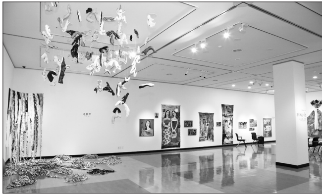
무주군 최북미술관이 지난해 문화체육관광부에서 실시한 '2023년 공립미술관 평가인증'을 통과했다. 사진은 무주 최북미술관 기획전 '부드러운 시선' 모습