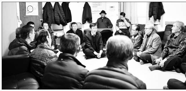
최훈식 장수군수는 지난 2일 새해를 맞아 관내 7개 읍·면 대표 경로당을 찾아 어르신들께 새해를 드리고 덕담을 나눴다.

카드 발급 신청을 하지 않은 청소년은 주소지 관할 읍·면사무소에서 신청할 수 있으며, 카드 소개, 가맹점 안내, 잔액/사용 내역 조회 등은 장수군 청소년 꿈키움 바우처 카드 홈페이지( https://jangsu.dvous.or.kr )에서 확인 가능하다. /장수=고관호 기자