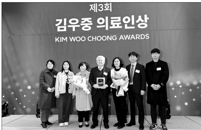
무주군이 제3회 김우중 의료인상을 수상했다.

또 △찾아가는 통합이동건강증진센터 운영(2015년~), 5일 잠터에서 진행, 검사 수치(혈압, 혈당 등) 데이터 구축을 통한 건강 컨설팅(2023년 무주군 민원 제도 개선 우수사례), △장애