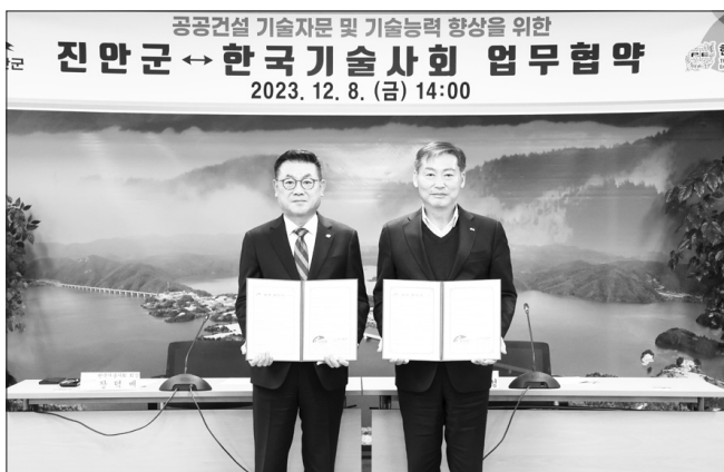
진안군은 지난 8일 공공건설사업 품질확보 및 기술자문, 건설공무원 기술능력 향상을 위해 한국기술사회와 업무협약을 체결했다.

해 진안군은 한국기술사회의 전문적인 지식과 풍부한 경험 등을 활용해 앞으로 신규 추진하는 공공건설사업의 품질확보 및 기술자문은 물론 건설공무원의 기술능력 향상에도 큰 도움