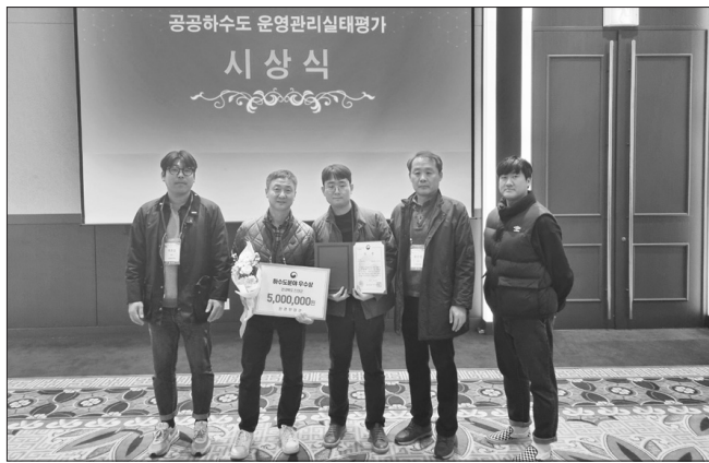
진안군은 지난 11월 30일 제주 부영호텔앤리조트에서 열린 '2023년도 공공하수도 운영·관리 실태평가 우수기관 시상식'에서 우수상을 수상했다.

서 주는 감사패를 받았다. 유호연 무주군 부군수는 축사를 통해 "무주군 문화예술 활성화를 주도해 주시는 무주문화원 측에 깊은 감사를 전한다"며 "지역과 국가의 발전은 문화예술의 발전과 그 맥을 같이 하는 만큼 지역 내 문화예술 확산에 더욱 주력해 줄 것"을 당부했다. 최북미술관 1층 로비에는 지난 11월 27일부터 '내추럴 못 만들기'와 '레진 플루이드아트', '보타니컬', '서예' 등 올해 문화학교 수료자들의 작품 전시회가 열려 주민 등 관람객들의 눈길을 사로잡았다. /무주=전문선 기자