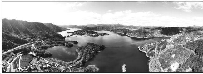
진안군은 2024년도 금강수계 상수원 구역의 수질개선과 상수원관리지역 주민지원 사업 등을 추진하기 위한 금강수계관리기금 96억원을 확보했다. (사진은 상전 대구평마을)

특히 이번 기금 확보액은 2023년 대비 7억7000만원, 2022년 대비 30억원이 증액된 금액으로 진안군은 기금 확보를 위해 매년 지속적으로 신규 사업을 적극 발굴하고, 전라북도를 비롯해 금강유역환경청 등 여러 관계 부처의 문