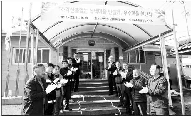
무주군은 부남면 상평당마을과 안성면 신무마을, 금평마을 등 3곳을 '2023년 소각 산불 없는 녹색마을'로 선정했으며 15일에는 부남면 상평당마을에서 현판식을 가졌다.

황인홍 무주군수는 “오늘의 영예는 주민 모두가 산불 예방을 위해 적극 노력해주시는 덕분에 이룬 것”이라며 “우리 군의 제1자산업자 자랑스런 산림이 마을에서부터 안전하게 지켜질 수 있도록 앞으로 더욱 노력해가자”고 전했다.