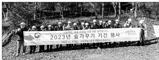
무주국유림관리소는 국립덕유산자연휴양림 내 독일가문비숲에서 8일 관리소 직원 등 20명이 참석한 가운데 가지치기, 임내정리, 덩굴류제거 등 숲가꾸기 행사를 실시했다.