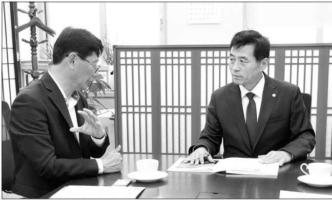
최훈식 장수군수가 7일 국회를 방문해 김민기 국토교통위원장을 만나 현안사업 반영을 위해 적극 협조해줄 것을 요청했다.

지난 제5차 국도·국지도 건설계획에 장수군 사업만이 미반영돼 소외됐던 만큼 장수군의 열악한 도로 여건으로 인한 사망률이 전국 대비 3.5배 수준임을 강조하며, 지역소멸 가속에 따라 이번 6차에는 건의 사업을 반영해 달라고 요청했다.