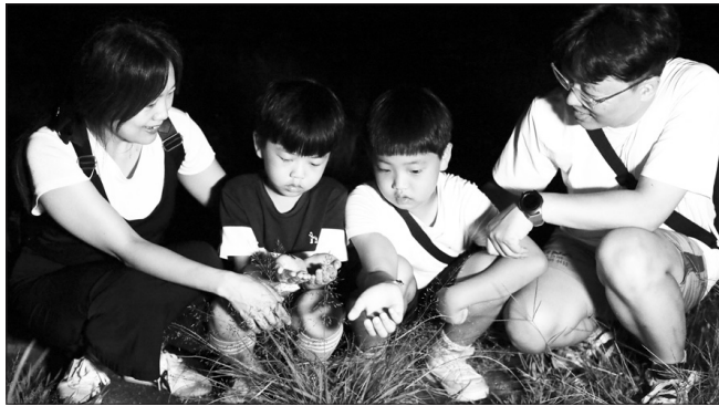
무주반딧불축제 반딧불이 신비탐사 모습

반딧불축제를 앞두고 신비탐사 인터넷 사전 예약이 시작된 8월 10일에는 1만 명이 넘는 접속자가 몰렸고, 축제가 시작된 9월 2일에는 3만 명이 넘는 사람들이 예매 사이트에 접속해 인기를 실감했다"며 "반딧불이 보호와 탐사객들의 안전을 고려해 인원수를 제한하기 때문에 올해는 9일간 총 8천 6백여 명만 탐사에 참여할 수 있었다"고 밝혔다. 이어 "반딧불이 신비탐사에 꼭 참여하고 싶으시다면 고향사랑