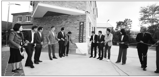
진안군은 19일 청년 농촌체험교육시설인 진안군 청년 with 꿀벌집 개소식을 가졌다.