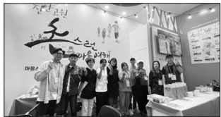
관과 해외관, 트렌드 테마여행관으로 구성됐다.

이번 트래블쇼 2023 박람회는 하반기 최대 규모 여행박람회로 메가소(주)서울전람이 주최하고 SBS골프가 후원해 300개 부스가 참여하고 잠재 여행객 5만명이 참가하는 대규모 행사로 국내