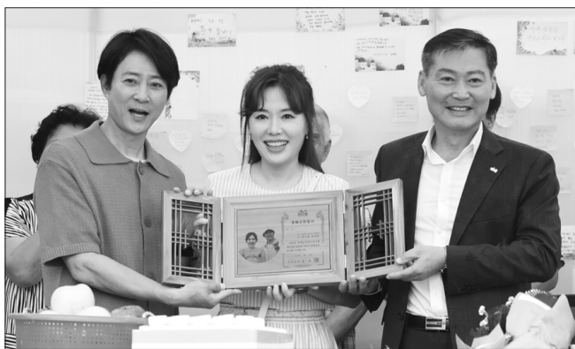
전춘성 진안군수가 최수종 하희라 부부에게 명예군민증서를 수여했다.

진안군은 16일 방송인이자 배우인 최수종·하희라 부부(이하 수라부부)에게 명예 군민증을 수여했다고 밝혔다. 수라부부는 진안군 안전면 구례마을에서 촬영한 KBS 2TV 예능 '세컨하우스2'에 출연해 농촌 빈집문제의 심각성을 알리고, 진안에 대한 호감도를 높였다.