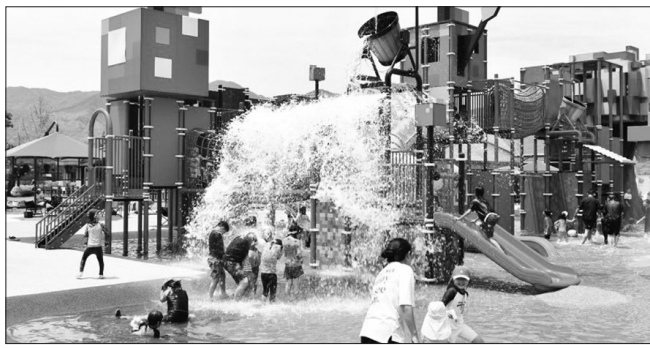
장수 누리파크 발물놀이장

올해 처음 개장한 장수 누리파크 발물놀이장이 연일 관광객들의 발길이 이어지며 장수군의 새로운 명소가 떠오르고 있다. 장수 누리파크 발물놀이장은 게임 속 나라를 그대로 옮겨놓은 듯한 마인크래프트 모양의 물놀이장으로 아이들의 상상력을 자극하는 알록달록한 색깔과 다양한 블록 모양의 시설들로 관내 아이들뿐만 아니라 인근 타 지역의 어린이들도 자주 찾고 있다. 또한 수심이 깊지 않아 어린 아이들도 물놀이하기 좋아 가족 단위 관광객들이 특히 많다. 누리파크 발물놀이장은 누구나 입장이 가능하며, 하루종일 신나게 놀아도 무료다. 매 시간 정각마다 40분씩 운영되고, 20분의 휴식시간을 가지며 안전요원들이 항상 대기하고 있어 안전하게 물놀이를 즐길 수 있다. 무엇보다 누리파크 내에는 동물