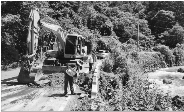
무주군은 지난 13일부터 호우가 집중되면서 피해를 입은 군도 및 농어촌도로에 대한 응급복구에 나섰다.

무주군은 지난 13일부터 호우가 집중되면서 피해를 입은 군도 및 농어촌 도로에 대한 응급복구에 나섰다 무주군에 따르면 23일까지의 누적 강수량은 326mm로 이로 인해 6개 읍·면 곳곳에서 도로 세굴(빗물로 인한 도로 패임)과 도로 침수, 도로 토사 유출, 도로 사면붕괴, 배수로 박힘, 우수 맨홀 막힘, 나무 쓰러짐, 낙석 등 112건의 피해가 발생했다.