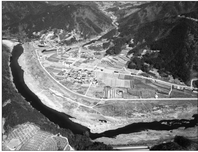
무주군 무주읍 후도마을 전경

기타 공공형 외국인 계절근로자 이용에 궁금한 사항은 진안군농협조합 공동사업법인(063-430-9474)로 진안군청 농업정책과 인력지원팀(063-430-8664)로 하면 된다. /진안=우태만 기자