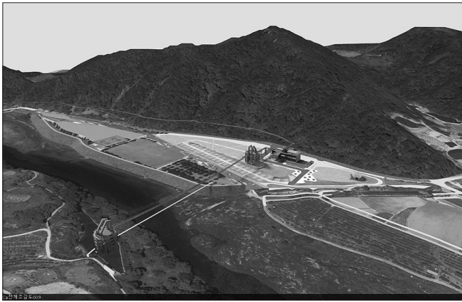
부남 금강변 관광자원 활성화 사업 조감도

무주군이 올해부터 1천만 관광객 시대를 향한 새로운 관광기반시설을 구축하면서 국내 명품 관광지 개발에 전력을 쏟는다. 무주군에 따르면 관광자원화와 지역 발전을 가속화 시킬 무주 생태모험공원 조성사업을 비롯한 안성 칠연지구 사업 등 관광개발 사업이 내년말 목표로 순조롭게 추진 중이다. 무주읍 당산리 일원에 추진되는 무주 생태모험공원 조성 사업은 총사업비 196억 원을 들여 체류형 관광단지과 가족형 레저테마파크로 조성하며, 생태문화체험관과 레포츠체험장 등을 조성한다. 올해 3월부터 단계별 사업을 추진하고 2024년 12월 마무리할 계획이다. 안성 칠연지구 일원 천혜의 자연자원을 활용해 조성될 안성 칠연지구 관광자원화 사업도 올해 본격 착수된다. 사업비 164억 원을 투입해 지난해 3월 착공한 안성면 공거리 신6 일원에 마련될 안성 칠연지구 관광자원화 사업은 오는 2024년 6월 마무리한다. 마을숲속 놀이터와 휴게쉼터, 칠연계곡 산림욕장 등을 갖춘다. 안성 칠연지구의 랜드마크라 할 수 있는 용추폭포에서 덕유산 칠연폭포까지 산림생태탐방로(둘레길)을 연결해 안성 칠연 고유의 자연생태자원 학습공간으로 추진돼 칠연지구의 4계절 관광 상품화 및 관광명성 회복으로 지역관광 활성화가 기대된다.