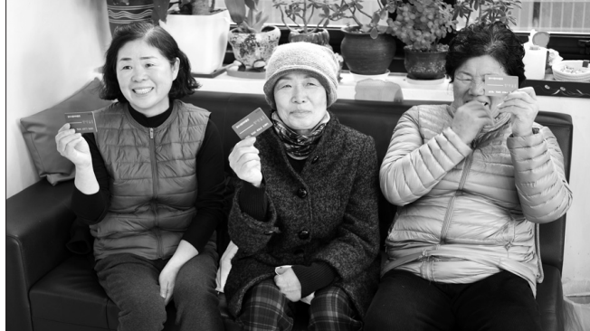
장수군은 올해부터 어르신들을 위한 이·미용비 지원사업과 취약계층 목욕비 지원사업에 대해 사용자 편의 증진을 위해 이용권을 당초 지류 형태에서 바우처 카드로 변경하고 사업비를 증액해 시행한다.

한편 장수군은 사업 추진을 위해 관내 48개 이·미용업소와 3개 목욕업소를 대상으로 지난해 12월 협약을 체결한 바 있다. /장수=고판호 기자