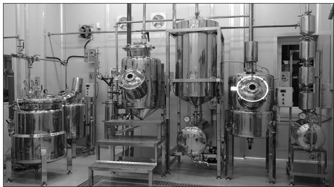
진안군은 홍삼농축액 생산을 위해 농산물종합가공센터에 농축실 구축을 완료했다.