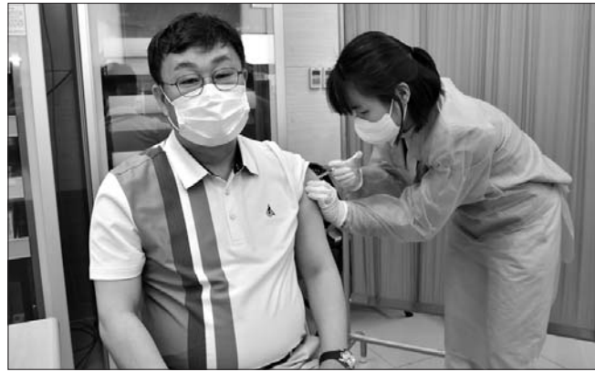
장영수 장수군수가 1일 장수군보건의료원에서 코로나19 이스트라제네카 예방접종을 하고 있다. 장영수 군수는 코로나 예방접종의 안전성을 알리기 위해 이날 전북지역 지방자치단체장으로는 첫번째로 백신을 접종했다.

에 대해서도 강조, 국가 공모사업 등을 분석하고 정부 주요 정책에 맞춰 신규 사업들을 발굴해줄 것을 당부했으며 발굴한 사업들이 지역발전과 주민행복을 위해 꼭 추진이 돼야 하는 점 등을 관련 부처에 적극 어필해 예산 확보로 이어질 수 있도록 하자는 내용도 덧붙였다. /무주=전문선 기자