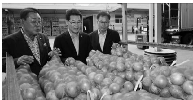
부안군이 가격 폭락으로 어려움을 겪고 있는 양파농가를 위해 부안마케팅농조합법인과 함께 부안양파 72톤을 지난 23일 베트남에 수출했다.