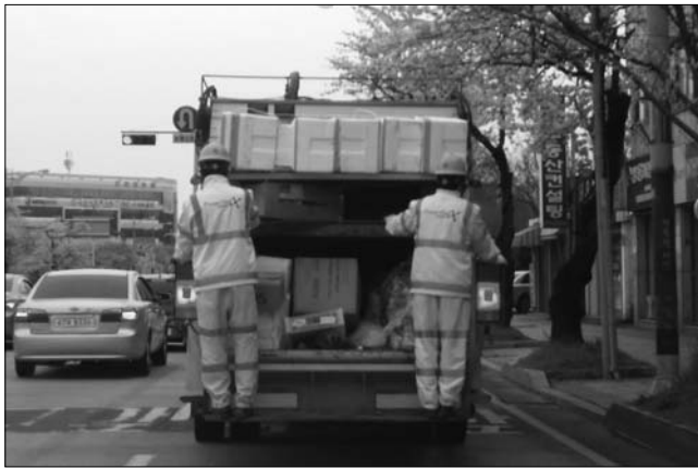
도심 곳곳에서 청소차 뒷편 적재함에 환경미화원 한 두 명이 위태롭게 매달려 이동하는 것을 볼 수 있다.

깨끗한 도심환경을 조성하기 위해 노력하는 환경미화원들이 위험한 근무환경에 노출돼 있어 대책마련이 요구된다. 도심 곳곳에서 청소차 뒷편 적재대에 환경미화원 한 두 명이 위태롭게 매달려 이동하는 것을 볼 수 있다. 이는 작업시간 단축을 위해 위탁업체에서 청소차를 개조 한 것으로, 적재함에 부착된 발판(폭30cm정도)에 매달려 승·하차를 하면서 수시로 수거 작업을 하는 환경미화원들에게는 치명적인 위험요소로 작용한다. 이처럼 발판에 매달려 이동 시 손잡이를 제대로 잡지 않은 상태에서 차량이 출발하거나 급제동 또는 과속방지턱을 넘거나 회전 할 때 몸의 균형을 잡지 못해 떨어질 위험이 크다. 특히, 환경미화원들이 발판 위에 올라 차에 매달려 있다가 사고를 당할 경우 보험 등의 혜택을 받지 못한다. 이는 발판과 손잡이를 부착한 구조 변경 자체가 불법이기 때문이다. 자동차관리법 34조 1항에는 차량의 구조와 장치 변경은 지방자치단체장의 승인을 받아야 하며, 불법 개조한 차량에 대한 단속 권한은 지자체장에게 있다고 명시돼 있다.