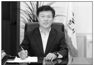
이학수 시장은 25일 영산강부회의에서 다가오는 추석 연휴 기간 공직기강을 확립하고 시민불편 최소화를 위해 기능별 대책마련에 대해 강조했다.

이학수 시장이 25일 영산강부회의에서 다가오는 추석 연휴 기간 공직기강을 확립하고 시민불편 최소화를 위해 기능별 대책마련에 대해 강조했다. 이 시장은 "8일간의 추석 연휴기간 동안 행정공백을 최소화하고 시민 불편이 없도록 행정 대책을 마련하고 점검하라"며 "특히 음주운전과 같은 공직기강 해이 사항이 절대 발생하지 않도록 해달라"고 당부했다.