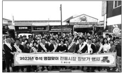
부안군은 25일 추석을 맞아 고물가 상황으로 위축된 전통시장에 활력을 불어넣기 위해 전통시장 장보기 행사를 가졌다.

부안군은 25일 추석을 맞아 고물가 상황으로 위축된 전통시장에 활력을 불어넣기 위해 전통시장 장보기 행사를 가졌다. 이번 장보기 행사는 부안상설시장, 시작으로 출포상설시장, 곰소시장, 부안로컬푸드 직매장에서 진행되었으며, 부서별 장보기 장소와 담당구역을 지정하여 전통시장 전방에 걸쳐 소비가 촉진될 수 있도록 추진되었다. 권익현 군수와 지역내 유관기관, 사회단체, 부안군여성소비자연맹회 등 500여명이 전통시장 장보기 행사에 참여하였으며, 부안사랑상품권을 사용하여 명절선물과 농특산물, 제수용품 등 각종 필요한 물품을 구입하고 전통시장 이용활성화와 부안사랑상품권 이용 홍보도 함께 실시했다. 권익현 부안군수는 "부안군의 장보기 행사가 전통시장 활성화에 조금이나마 도움이 되길 바란다"며 "전통시장의 활성화가 곧 지역 경제 활성화로