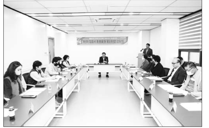
정읍시는 지난 10일 어르신 돌봄 요원의 권익증진과 서비스 이용 대상자들의 편의 증진을 위해 '제1기 돌봄 요원 모니터단' 1차 간담회를 열었다.