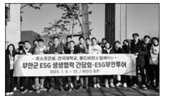
별키우기 비호텔 조성 논의, 갯벌복원 및 반려해변 협력, 위케어센터 협력, 부안으로 ESG 현장 투어 순으로 진행됐다.

이번 간담회는 행정과 기업, 대학, NGO가 ESG 경영 비전을 공유하면서 상호 이해증진을 도모, 상생협력 연계 방안 논의 등을 통해 지속가능한 ESG 협력발전체계를 구축하기 위해 마련됐다. 간담회는 부안군 일반현황 소개, 풀