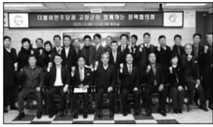
등) 등을 돌아보며 격려하는 시간을 가졌다.

고창군과 더불어민주당 지역위원회가 올해 첫 정책협의회를 갖고 국가예산 확보와 현안해결에 힘을 모으기로 했다.