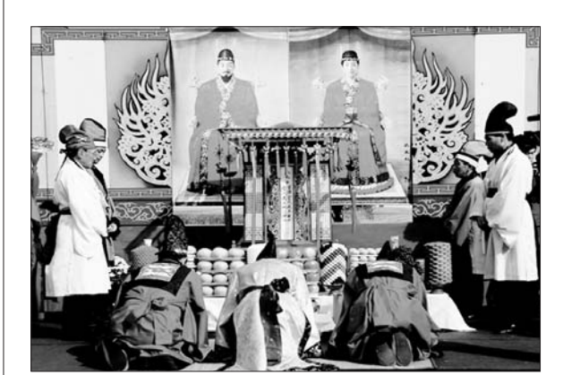
익산서동축제의 무왕제례가 축제개막일인 익산문화원 주관으로 개최된다.

들어 호적에 실린 4,000호 중 양반가구가 1,500여호나 된다'는 등 조선 후기의 익산군 정황을 생생하게 전하고 있어서 금마지를 읽는 또 하나의 재미를 던져준다. 그동안 '금마지'는 미륵사지나 왕궁리유적 등 익산의 과거, 역사·문화 등 익산의 정체성을 규명하는 데 없어서는 안 될 귀중한 자료임에도 불구하고 번역되지 않아 원전을 읽을 수 있는 전문가들에 의해서만 일부 내용이 제한적으로 인용되어 왔었다. 익산시 관계자는 "향후 익산의 역사와 문화를 전해주는 문헌자료를 발굴해 보다 더 많은 사람들이 이 지역의 역사적 가치를 알 수 있도록 번역하는 작업을 지속적으로 진행할 예정이다"고 말했다. /익산=장인천 기자