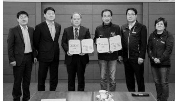
군산시와 민주노총이 단체협약을 체결했다.