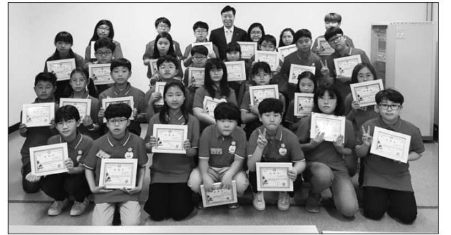
군산시는 올해 새롭게 선발된 청소년의원들을 대상으로 '2018년 청소년의회 아카데미'를 최근 열었다고 밝혔다.

해 예비 귀농귀촌인들이 정착의지를 갖고 성공적인 정착을 할 수 있도록 지원을 이끌어 내는 등 수요자 중심의 정책수립을 적극적으로 추진하겠다”고 말했다. 덧붙여 “익산시는 원예, 과수, 축산이 고르게 분포하고 있으며 탁월한 교통망으로 수도권으로의 용이한 접근성과 인근 전주, 군산 등 근교농업 도시 농업기반 입지가 좋아 도시민 농촌유치를 통해 농업인구의 유지 및 지역경제 활성화로 충분한 에너지와 가치를 가지고 있다”며 “예비 귀농인의 우리시로의 정주의향, 이주준비, 이주실행, 이주정착의 단계별 맞춤형 서비스를 제공할 것”이라고 강조했다. /익산=장영원 기자