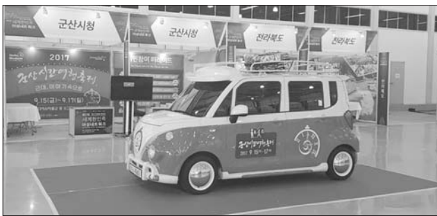
군산 시내와 전국을 다니며 홍보대사 역할을 톡톡히 담당하고 있는 '올드카 콘셉트차량'은 서울, 여수, 인천 등 전국의 20여개 시·군을 순회하며 로드마케팅을 펼쳤다.

아울러 시민 참여로 운영될 예정인 '군산 뉴스(라디오-토코쇼)', '1930's(커피)이야기', '두레다솜 시간이야기(소원등 릴레이, 부연이 체험) 등에서 행사의 기획·준비-