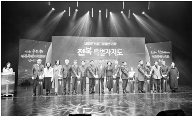
익산시가 전북특별자치도 출범을 맞아 17일 숨리문화예술회관 중공연장에서 기념 행사를 개최했다.

익산시가 전북특별자치도 출범을 맞아 17일 숨리문화예술회관 중공연장에서 기념 행사를 개최했다. 행사는 기관, 사회단체, 시민 등 500여 명이 참석한 가운데 시립풍물단과 시립무용단의 식전 공연을 시작으로 기념식과 축하 퍼포먼스, 식후 공연 순서로 진행됐다. 무대는 화려한 빛의 향연을 선보인 LED 비보잉과 초대 가수 김운의 축하 공연으로 행사의 다채로움을 더했다. 특히 시민 50여 명의 자발적인 참여로 진행된 플래시몹은 특별자치도민이 된 자부심을 자유롭게 표현해 눈길을 끌었다.