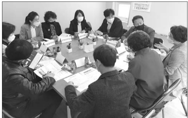
익산시의회는 의원연구단체인 ‘노후 공동주택 개선방향 연구모임’이 지난 30일 부송동 하나마을 관리사무실에서 대한주택관리사익산지부와 간담회를 개최했다