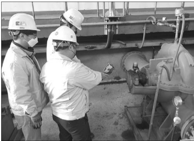
익산시는 오는 26일까지 신홍정수장을 비롯한 총 8개 시설을 대상으로 자체 상수도 점검을 진행한다.

녹아 지반침하 현상이 발생할 가능성이 있어 이를 방지하기 위해 진행된다. 시는 시설물의 누수·균열 여부와 배수지 법면 붕괴 여부를 점검할 방침이다. 특히 이번 점검에서는 기계 시설의