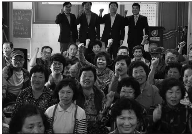
전북개발공사가 지난 24일 남원시 인월면 외건마을과 농·도 상생과 상호발전을 위해 1사1촌 자매결연 협약을 체결했다.